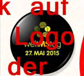
1 Welt MS Tag 2015

Klick auf das Logo mit der großen Schrift