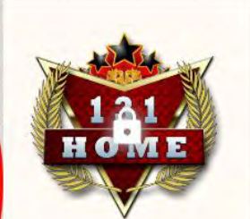
3 131 Home