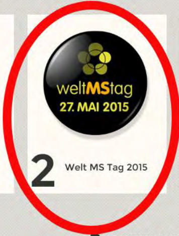
2 Welt MS Tag 2015